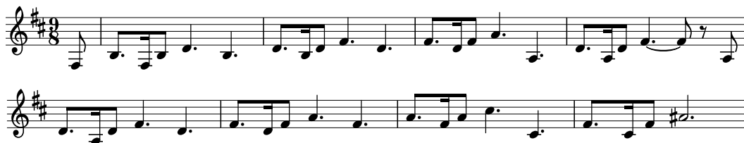
Notenbeispiel 3: Walkürenthema, Takte 37–44

Hier ist in der Filmttonspur der erste Audioschnitt zu erkennen: Statt der nächsten Takte (27–31) springt die Musik zu Takt 32 (37:31). Das geschnittene musikalische Material besteht aus einer Motivvariation, die in Takt 30, Zählzeit 4, auf h-Moll endet. Die gleiche Variante (Takte 32–36) endet in den darauffolgenden und erklingenden Takten auf H-Dur (35, Zählzeit 4); hier liegt synchron ein Schnitt auf eine Formation mit neun Helikoptern am Himmel (37:37). Die Bildführung kommt zur Ruhe. Auch mit dem einsetzenden, kraftvoller instrumentierten Walkürenthema (Takte 37–44, Notenbeispiel 3; 37:41) bleibt die Kamera auf der Formation: Sie führt zwei Schwenkfahrten über die Helikopter hinweg durch. Mit den Trompeten, Posaunen und der fanfarenartigen Motivik wirkt die Helikopterformation am Himmel erhaben und überlegen. Das Thema kommt jedoch nicht zum Schluss.